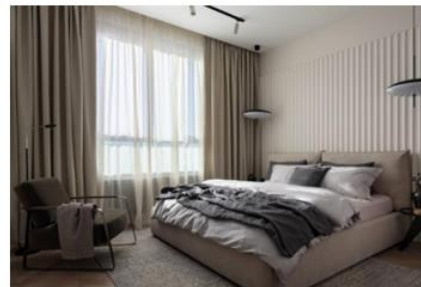
Фото 2 – нравится деревянная панель за кроватью, сочетание цветов

В первой картинке понравился сочетание цветов, но подвесные светильники у кровати - не понравились. Кресло нужно с мягкими подлокотниками